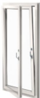
Ouverture oscillo-battant OF/ OB

Pour les grandes ouvertures : portes levantes coulissantes, portes coulissantes décrochantes ou portes-accordéon, faciles à manœuvrer, toutes étant respectivement proposées avec un seuil très plat spécialement adaptées aux personnes à mobilité réduite.