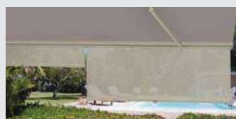
Lambrequin enroulable Modul'ombre